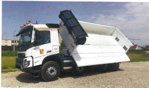
Camion bi-benne : un classique des versions carrossées.

à jour quotidienne. « Cela permet une approche rapide de notre de véhicules carrossés par les vendeurs ainsi que la possibilité, pour eux, de réserver un véhicule. Le site intègre plusieurs types de véhicules prêts à partir avec d'un côté les véhicules disponibles chez nous et, de l'autre, ceux mis en dépôt chez les carrossiers. Le portail « my business » dispose d'un moteur de recherche multi-critères (type de carrosserie, nom du carrossier, type de châssis...) » expliquent Laurent Grillon et Etienne Schmittbiel, en charge de l'offre prêt à partir chez Volvo Trucks. Le stock