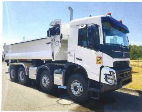
L'offre de Volvo Trucks évolue en fonction des besoins du marché pour répondre aux besoins du moment.