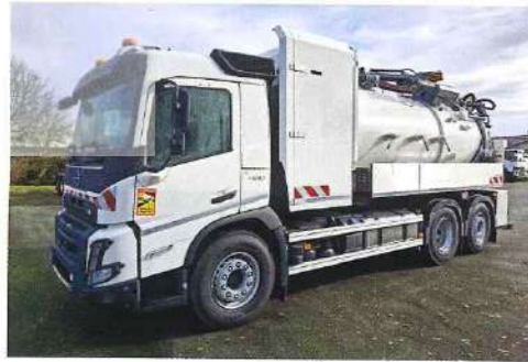
Les camions carrossés de Volvo sont regroupés sur le portail «my business».