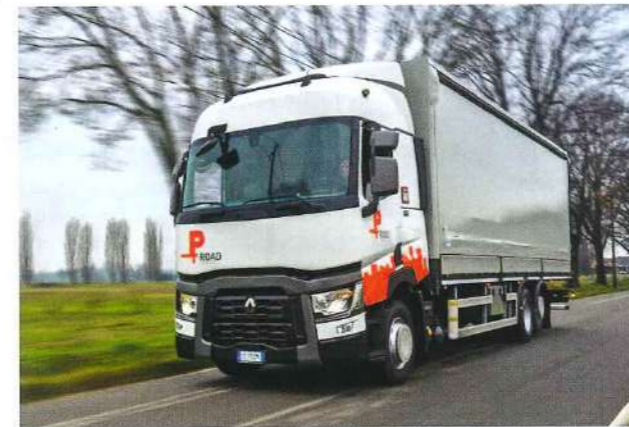
Le T P-Road a été intégré à l'offre de VI carrossés de Renault.